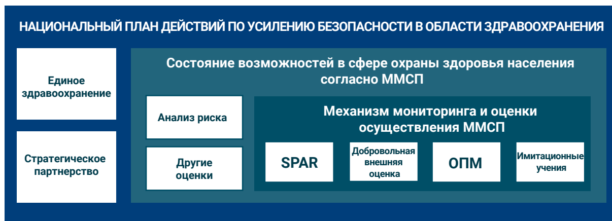
Рис. 2.1: Связь с Механизмом мониторинга и оценки осуществления ММСП

В опубликованном ВОЗ Практическом руководстве для стран по проведению обзоров принятых мер и имитационных учений в рамках Механизма мониторинга и оценки осуществления ММСП (2005 г.) предоставляется дальнейшая стратегическая и конкретная информация по критериям в отношении инициации проведения ОПМ, советы по разработке рекомендаций и отслеживанием осуществления мероприятий, предложенных участниками, а также обмену результатами с помощью шаблонной формы для составления отчета (3).