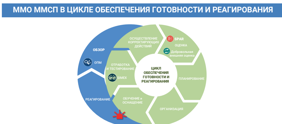
Рис. 1.2 Обзор принятых мер в цикле обеспечения готовности и реагирования

Проведение ОПМ предоставляет уникальную возможность пересмотра функциональных возможностей сектора здравоохранения и систем реагирования на чрезвычайные ситуации и выявления практических областей, нуждающиеся в непрерывном улучшении. ОПМ можно осуществлять как элемент цикла готовности и реагирования, как показано на Рис.1.2.