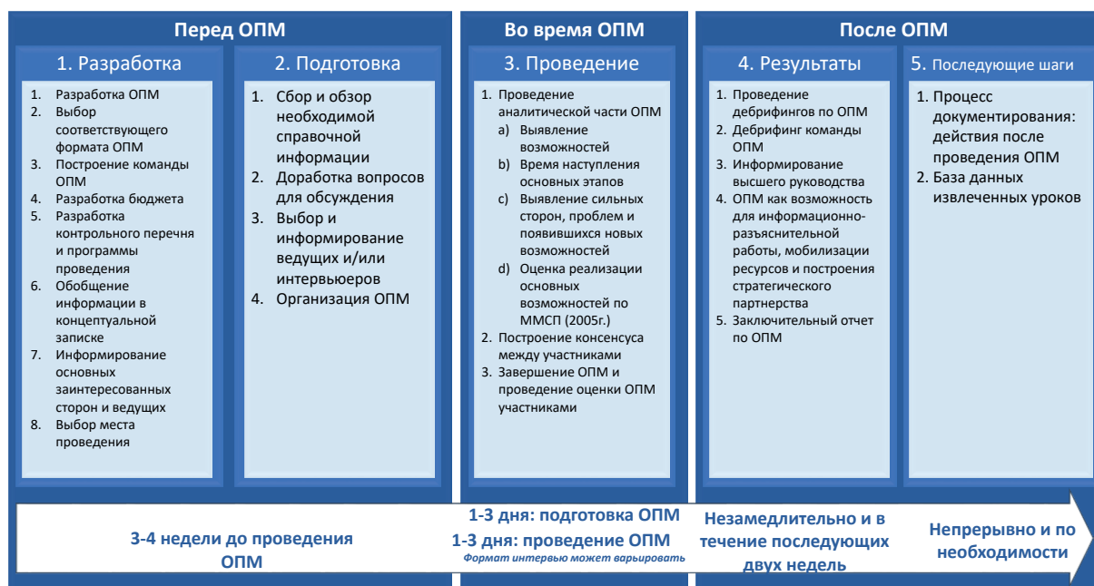
Рисунок 1.3 Дорожная карта для планирования ОПМ

К данному руководству прилагаются несколько наборов инструментов для разработки, подготовки, проведения и осуществления последующих действий по ОПМ. Подробное содержание каждого пособия и где их найти представлены в приложении 2 к данному документу. В инструментарий входят: