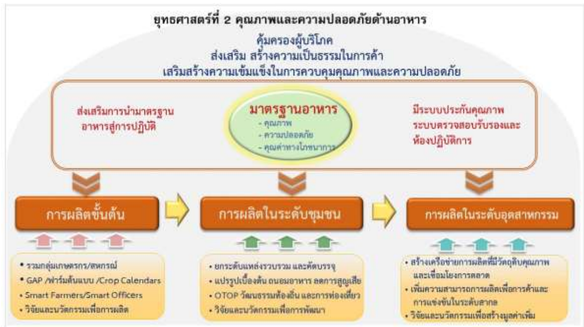
ภาพที่ ๓ กรอบแนวคิดในการกำหนดกลยุทธ์และแนวทางการดำเนินงานของยุทธศาสตร์ที่ ๒ ด้านคุณภาพและความปลอดภัยอาหาร

การดำเนินงานเพื่อส่งเสริมคุณภาพและความปลอดภัยอาหารต้องพิจารณาให้ครอบคลุมตลอดห่วงโซ่อาหาร ตั้งแต่คุณภาพและความปลอดภัยของผลผลิตจากการผลิตขั้นต้นในภาคเกษตร ที่จะมีส่วนต่อเนื่องไปสู่คุณภาพและความปลอดภัยของผลิตภัณฑ์อาหารจากการแปรรูป ทั้งระดับชุมชนและระดับอุตสาหกรรม จนถึงผู้บริโภคและการค้า โดยการดำเนินงานในส่วนอุปทานของห่วงโซ่อาหาร มีหัวใจสำคัญคือใช้ “มาตรฐาน” เป็นตัวขับเคลื่อนตลอดทั้งระบบ ทั้งมาตรฐานด้านคุณภาพอาหาร มาตรฐานด้านความปลอดภัยของอาหาร และมาตรฐานคุณภาพด้านโภชนาการ รวมทั้งมาตรฐานการผลิต พร้อมทั้งต้องมีมาตรการส่งเสริมการนำมาตรฐานไปสู่การปฏิบัติและมีระบบสนับสนุน ได้แก่ ระบบการประกันคุณภาพ ระบบตรวจสอบรับรองและห้องปฏิบัติการ ซึ่งหากการดำเนินงานในทุกส่วนเป็นไปตามมาตรฐานด้านต่างๆ ที่กำหนดแล้ว จะส่งผลให้ประชาชนได้รับอาหารที่มีคุณภาพและปลอดภัย อีกทั้งผู้บริโภคทั้งในและต่างประเทศ มีความเชื่อมั่นในคุณภาพและความปลอดภัยของอาหารไทย ซึ่งจะเป็นเครื่องมือช่วยส่งเสริมและลดอุปสรรคการค้า โดยเฉพาะอย่างยิ่งการส่งออกอาหารเพื่อสร้างรายได้ให้แก่ประเทศ