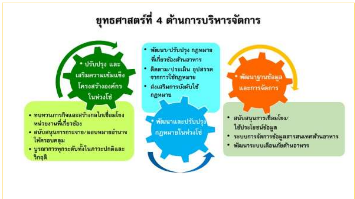
ภาพที่ ๕ กรอบแนวคิดในการกำหนดกลยุทธ์และแนวทางการดำเนินงานของยุทธศาสตร์ที่ ๔ ด้านการบริหารจัดการ

พระราชบัญญัติคณะกรรมการอาหารแห่งชาติ พ.ศ. ๒๕๕๑ กำหนดให้คณะกรรมการอาหารแห่งชาติมีอำนาจหน้าที่จัดทำยุทธศาสตร์ของชาติด้านอาหารตลอดห่วงโซ่ ในมิติความมั่นคงทางอาหาร คุณภาพและความปลอดภัยอาหาร และอาหารศึกษา เพื่อเสนอคณะรัฐมนตรีให้ความเห็นชอบและมอบหมายหน่วยงานที่เกี่ยวข้องดำเนินการตามอำนาจหน้าที่ให้บรรลุผลตามกรอบยุทธศาสตร์ฯ อย่างมีประสิทธิภาพและประสิทธิผลทั้งภาวะปกติและภาวะฉุกเฉิน ซึ่งการขับเคลื่อนยุทธศาสตร์ทั้ง ๓ ด้านดังกล่าวนั้น จำเป็นต้องมีปัจจัยสนับสนุนและเอื้ออำนวยให้ภาคส่วนต่างๆ ภายใต้กรอบยุทธศาสตร์ฯ สามารถดำเนินการให้บรรลุผลอย่างมีประสิทธิภาพและประสิทธิผล ทั้งนี้ ปัจจัยสนับสนุนดังกล่าวประกอบด้วย ปัจจัยด้านโครงสร้างองค์กรในห่วงโซ่อาหารที่เข้มแข็งและมีกลไกเชื่อมโยงการระหว่างหน่วยงาน เพื่อรองรับการดำเนินงานทั้งในภาวะปกติและภาวะวิกฤต รวมทั้งมีการกระจายอำนาจที่มีประสิทธิภาพ มีปัจจัยด้านกฎหมายที่เอื้อและไม่เป็นอุปสรรคต่อการดำเนินงาน และปัจจัยด้านฐานข้อมูลสำคัญเพื่อการขับเคลื่อนยุทธศาสตร์