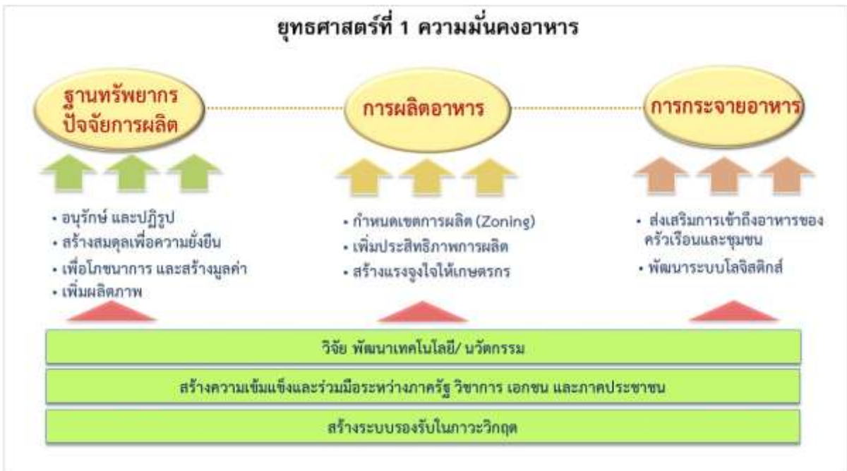
ภาพที่ ๒ กรอบแนวคิดในการกำหนดกลยุทธ์และแนวทางการดำเนินงาน ของยุทธศาสตร์ที่ ๑ ด้านความมั่นคงอาหาร

จากนิยามนี้ จะเห็นได้ว่าการดำเนินงานเพื่อรักษาความมั่นคงด้านอาหารของประเทศนั้น ต้องพิจารณาให้ครอบคลุมตั้งแต่ ความมั่นคงและยั่งยืนของฐานทรัพยากรธรรมชาติและปัจจัยการผลิต การบริหารจัดการในห่วงโซ่การผลิตให้เกิดการผลิตที่มีประสิทธิภาพและมีความยั่งยืน และระบบการกระจายอาหารที่มีประสิทธิภาพ ซึ่งหมายความรวมถึงการกระจายอาหารที่ส่งเสริมการบริโภคอาหารเพื่อโภชนาการและสุขภาพของประชาชน ทั้งนี้ การดำเนินงานขับเคลื่อนใน ๓ ส่วนหลักดังกล่าว จำเป็นต้องมีปัจจัยและโครงสร้างพื้นฐานสนับสนุนการดำเนินงานความมั่นคงด้านอาหารอันประกอบด้วย การวิจัย พัฒนาเทคโนโลยี และนวัตกรรม การมีเครือข่ายความร่วมมือของภาครัฐ วิชาการ เอกชนและภาคประชาชน และมีระบบรองรับในภาวะวิกฤติเพื่อรักษาเสถียรภาพความมั่นคงด้านอาหารและโภชนาการของประเทศ