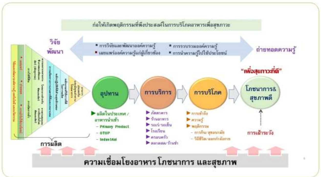
ภาพที่ ๓ กรอบแนวคิดความเชื่อมโยงการเกษตร-อาหาร-โภชนาการ-สุขภาพ