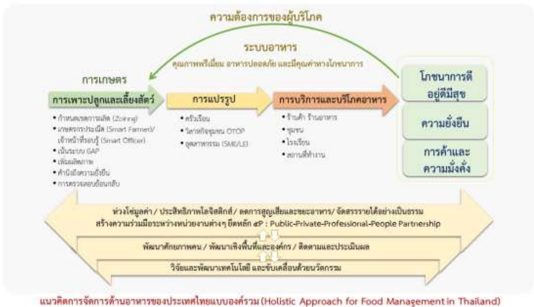
ภาพที่ ๑ แนวคิดการจัดการด้านอาหารของประเทศไทยแบบองค์รวม (Holistic Approach for Food Management in Thailand)

๕. เชื่อมโยง เป้าหมายการเกษตร อาหาร โภชนาการ สุขภาพ และการค้าให้สอดคล้องประสานกันตลอดห่วงโซ่เป็นองค์รวม นำไปสู่ความอยู่ดีมีสุข ยั่งยืน มั่นคงและมั่งคั่ง (ภาพที่ ๑-๓)