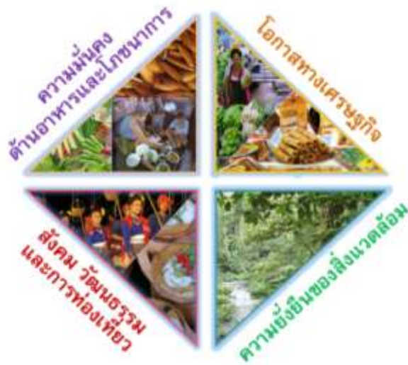
ภาพที่ ๒ กรอบแนวคิดผลสัมฤทธิ์จากระบบเกษตรและอาหารในมิติต่างๆ