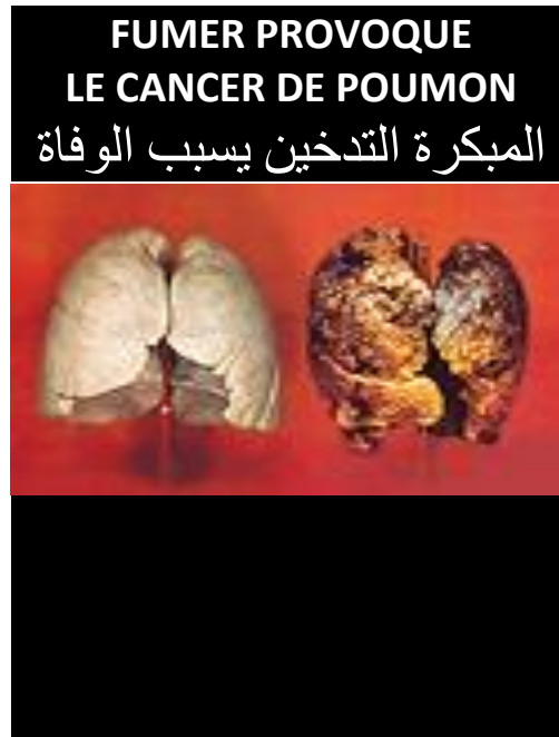
Avertissements sanitaires combinés 3