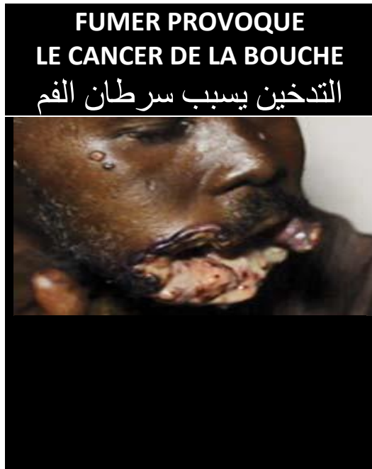
Avertissements sanitaires combinés 2