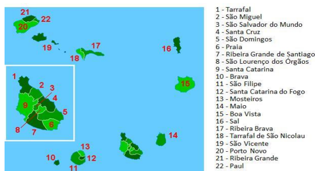
Fig 1: Divisão administrativa de Cabo Verde

Cabo Verde é um pequeno país arquipelágico, formado por dez ilhas - Santo Antão, São Vicente, Santa Luzia, São Nicolau, Sal, Boa Vista, Maio, Santiago, Fogo e Brava, totalizando uma superfície aproximada de 4.033 km 2 . Do ponto de vista administrativo encontra-se dividido em 22 Concelhos (ver Fig. 1)