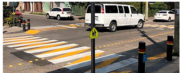
Crucero intervenido