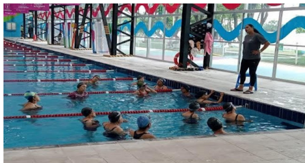
FOTO: Ejercitamiento en COMUDE