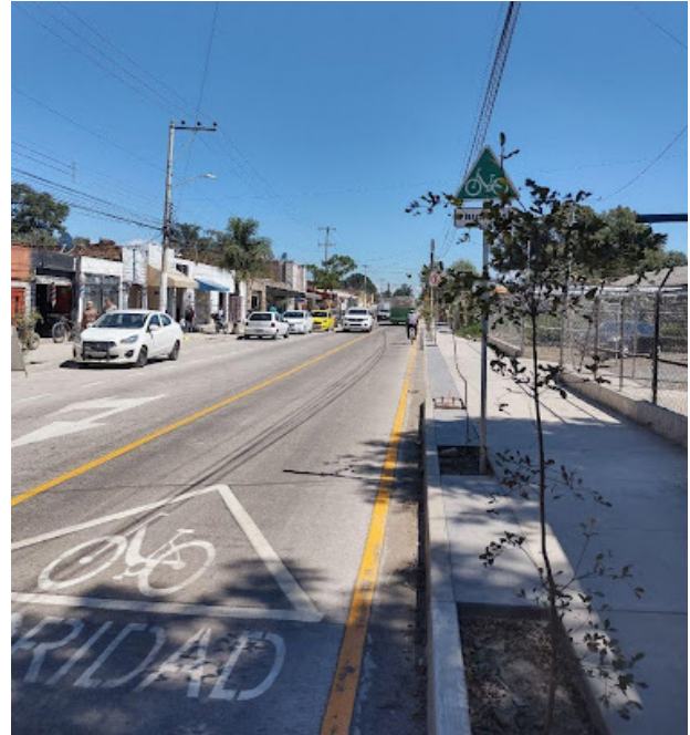
FOTO: Rediseño vial

Este esfuerzo forma parte de los compro-misos asumidos por el Gobierno de Zapopan para mejorar la calidad de vida de la ciuda-danía, asegurando que las vías públicas no solo sirvan como corredores de tránsito, sino también como lugares de encuentro y disfrute para la comunidad en general.