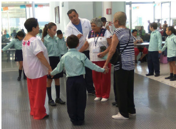
FOTO: Taller intergeneracional