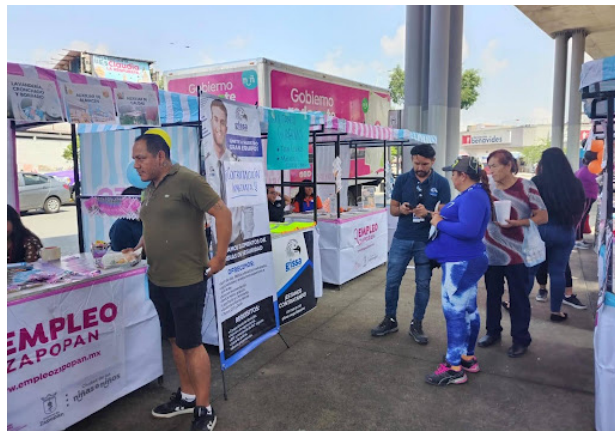
FOTO: Feria del empleo

También existen Ferias de Empleo que se realizan cada último jueves del mes en el Centro Cultural Constitución, con ubicación en la colonia Constitución, la cual presenta mayor concentración de personas mayores en todo el municipio. En 2024 este evento ha permitido conectar con más de 20 empresas a 220 personas y 55 personas mayores a través de sus módulos de reclutamiento. Además, cuenta con un módulo dedicado a la agilización de expedición de RFC por parte del SAT.