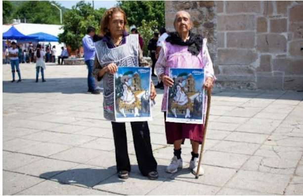
FOTO: Encuentro cultural