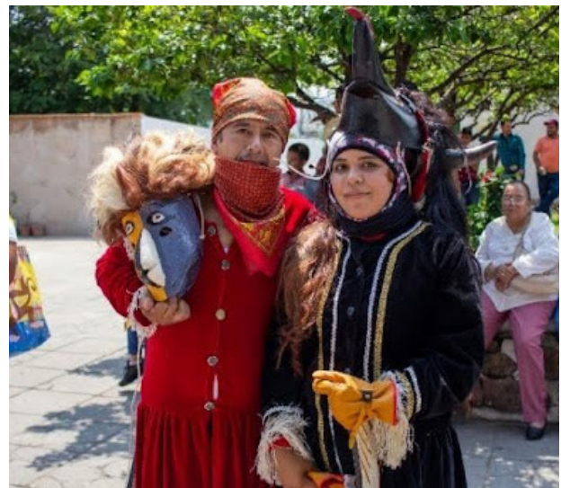
FOTO: Encuentro cultural

En las últimas fiestas se registró la colaboración de 133 mil participantes y asistentes, con la participación de 13 mil personas mayores.