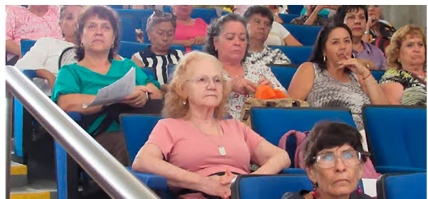
FOTO: Asistentes a charlas en Cemam

El esfuerzo conjunto de estas instituciones ha permitido una atención más integral y eficiente a los casos de maltrato. Sin embargo, se ha observado un incremento en el promedio de casos mensuales que también se puede interpretar como una mayor conciencia y disposición de denuncia. Hasta la fecha se han registrado y denunciado 132 casos de maltrato a personas mayores.