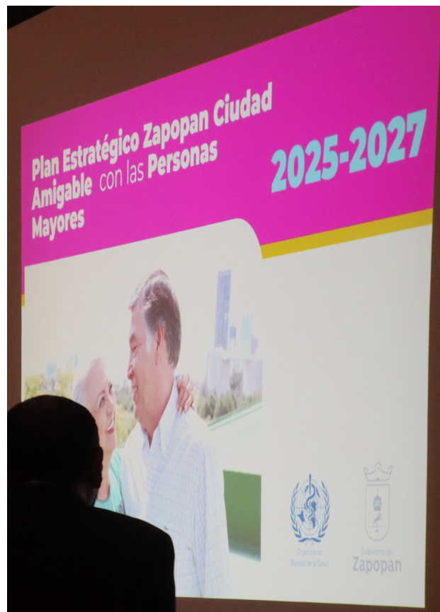
FOTO: Presentación del Plan Estratégico 2025-2027