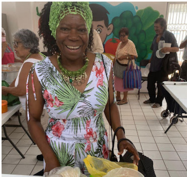
FOTO: Apoyo de comedores

Este programa cuenta con seis comedores comunitarios ubicados en las colonias: Haciendas de Tesistán, Miramar, Valle de los Molinos, Villas de Guadalupe, Las Mesas y San Juan de Ocotán y ha beneficiado a 3,578 personas, de las cuales 477 son personas mayores, entre ellas 285 mujeres y 219 hombres.