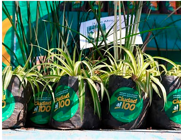
FOTO: Plantas dadas a través del programa

Otro sector que ha mostrado un notable interés ha sido el de las infancias, quienes representan el segundo grupo más beneficiado al adquirir las plantas a través de la gestión de sus madres o padres.