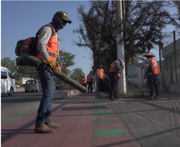
FOTO: Mejora de espacios públicos