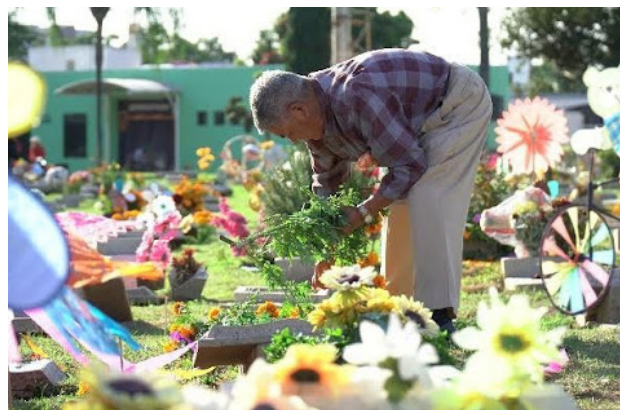
FOTO: Día de Muertos

La destacada participación de las personas mayores fue esencial para el éxito de estas festividades. Su experiencia y conocimiento de las tradiciones desempeñaron un papel crucial en la transmisión de prácticas culturales a las nuevas generaciones, asegurando así la continuidad de estas valiosas costumbres. La inclusión activa de las personas mayores no solo enriqueció las celebraciones, sino que también proporcionó un espacio de reconocimiento y respeto hacia ellos, fomentando una comunidad más cohesionada y solidaria.