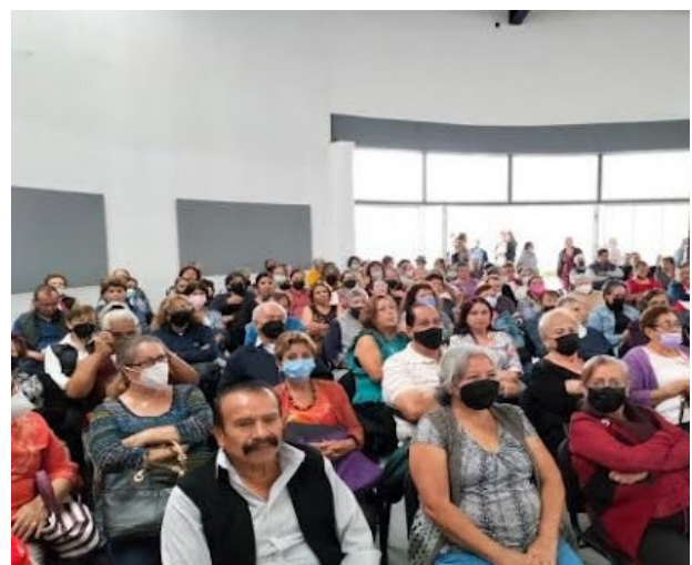
FOTO: Charla de sensibilización

La transformación de un entorno va más allá de la infraestructura urbana o apoyos que se puedan brindar, una de las partes medulares es el constructo social alrededor de las narrativas sociales y acciones que se efectúan todos los días, en este sentido, a través de charlas se ha tenido por propósito el difundir información relevante en temáticas tales como el desarrollo de una vejez saludables, la resignificación de la persona mayor en el siglo XXI, profundización y detección de violencias, así como la demanda continua de un trato digno en cada uno de sus entornos, a la actualidad se tiene registro de 3 charlas con un impacto de 800 personas mayores beneficiadas directamente.