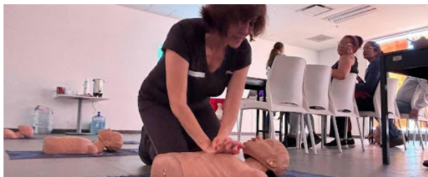
FOTO: Curso de primeros auxilios

La iniciativa busca formar brigadistas que actúen en primera línea para atender emergencias y capacitar a la ciudadanía en las prácticas adecuadas para apoyar a los grupos vulnerables durante las evacuaciones. Según reportes, la meta propuesta de capacitaciones fue alcanzada en un 99% en el mes de julio, con 39,598 personas capacitadas de una meta de 40,000. De estos, 3,429 han sido personas mayores, demostrando un notable compromiso con la inclusión y el apoyo a este grupo en situaciones de emergencia.