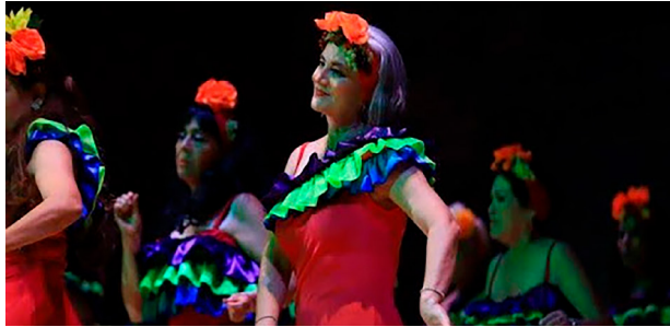
FOTO: Presentación artística del grupo de danza de adultos mayores