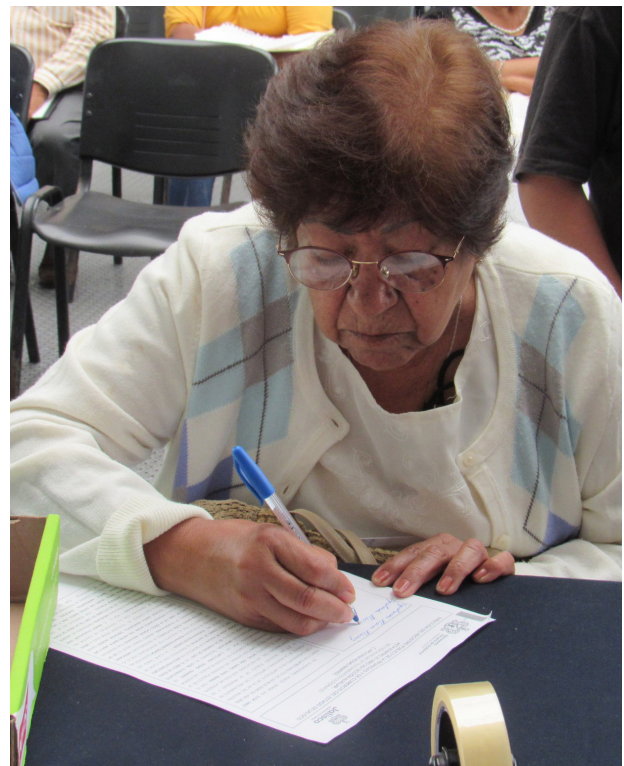
FOTO: Atención en módulo

En sentido de disminuir esta brecha, se han creado campañas en relación con el tema de rezago educativo y registros, así se logró otorgar a siete personas mayores sus actas testimoniales para registros extemporáneos de nacimiento.