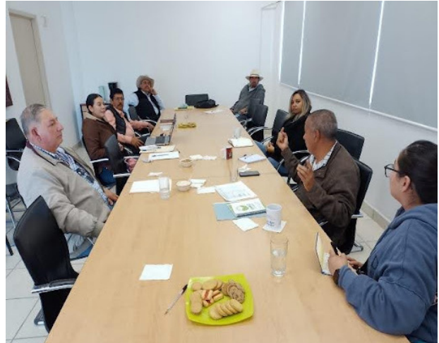
FOTO: Apoyo a productores rurales

Además del apoyo económico, se están desarrollando programas complementarios que incluyen capacitación técnica y asesoría personalizada, con el objetivo de maximizar los beneficios del apoyo otorgado y garantizar la adopción de prácticas sostenibles y eficientes. Este enfoque integral busca fortalecer el desarrollo económico de las y los productores, mejorar la calidad de vida de las personas mayores y contribuir al bienestar general del sector agrícola en la región.