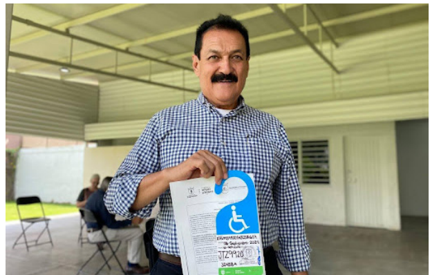
FOTO: Beneficiario de la acreditación gratuita

Para asegurar estos objetivos, la Dirección de Movilidad y Transporte ha implementado un sistema de acreditaciones gratuitas específicamente diseñado, que permite a estos grupos estacionarse en los lugares azules reservados distribuidos estratégicamente por todo el municipio. Hasta la fecha, se han emitido un total de 12,980 de estas acreditaciones, facilitando así el acceso a servicios esenciales y mejorando la calidad de vida de quienes más lo necesitan en nuestra comunidad.