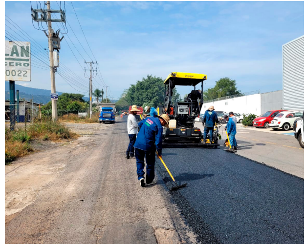
FOTO: Mantenimiento vial

Las actividades realizadas consistieron en servicios de mantenimiento superficial, preventivo y correctivo del pavimento, asegurando que las calles sean espacios seguros y cómodos tanto para las personas mayores como para la ciudadanía y transeúntes del municipio.