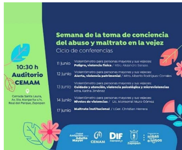
FOTO: Ciclo de conferencias

Gracias a la presencia que tenemos en diversas redes sociales, se ha logrado llegar a 297 mil personas, quienes interactúan positivamente con el contenido. Destaca la comunidad de Facebook Cemam, que reúne a 8,900 adultos mayores.