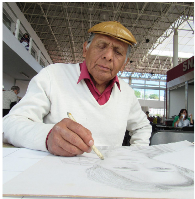
FOTO: Taller artístico de Adulto Mayor