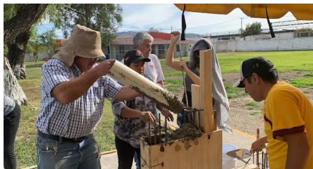
FOTO: Diplomado en Construcción de Edificación

Por otro lado, Modelo Dual es un programa que ofrece cursos de capacitación teórico-práctico diseñados para que las y los interesados adquieran habilidades y conocimientos del mercado laboral actual, al mismo tiempo que satisface las necesidades de empleo de las empresas o subsidios para el pago de estos, también se ofrecen para aquellos que ya cuentan con un trabajo. Este año se realizó un Diplomado en Construcción de Edificación en colaboración con CMIC y una capacitación especializada en Metal-Mecánica en colaboración con Flex en las que asistieron 25 personas.