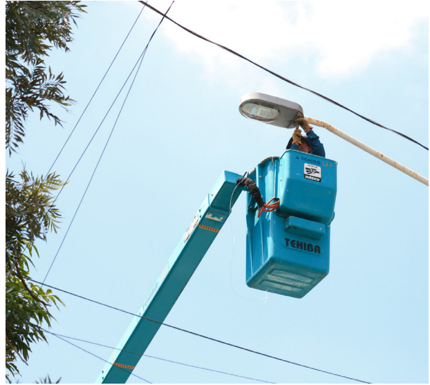
FOTO: Cambio de luminarias