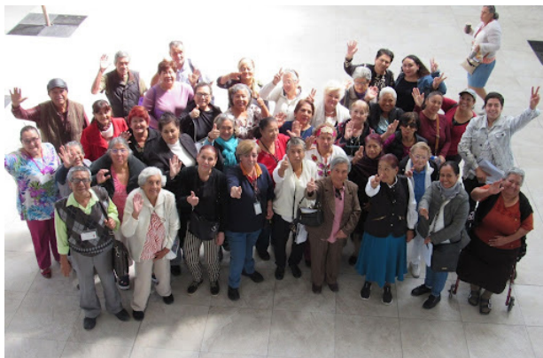
FOTO: Miembros de Clubes de Adulto Mayor

Estas Mesas Directivas y clubes no solo proporcionan un espacio para la socialización y el apoyo mutuo entre las personas mayores, sino que también promueven la participación continua en actividades recreativas, educativas y de desarrollo personal. A través de las sesiones de trabajo, se asegura que las necesidades y opiniones de las personas mayores sean escuchadas y consideradas en la toma de decisiones.