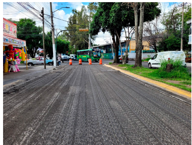
FOTO: Mantenimiento vial

Con el objetivo de abordar las áreas con mayor número de reportes por parte de la ciudadanía y continuar proporcionando superficies adecuadas para el tránsito vehicular, la Dirección de Pavimentos implementó rutas estratégicas para atender aquellas zonas más afectadas por el desgaste debido al paso vehicular o al fin de su vida útil.