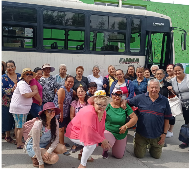
FOTO: Visita al parque acuático Cañón de las Flores

Al corte indicado se han beneficiado a 141 personas mayores pertenecientes a colonias de mayor vulnerabilidad, que no tienen la posibilidad de realizar este tipo de recorridos turísticos o acceder a deportes adecuados para su salud como es la natación, el disfrute del agua y el contacto con la naturaleza.