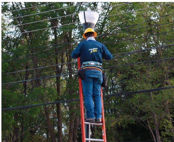
FOTO: Cambio de luminarias

La implementación del programa ha tenido un impacto directo en la calidad de vida de las personas mayores, promoviendo la seguridad personal, reduciendo la criminalidad, fomentando el bienestar psicológico y facilitando la movilidad y accesibilidad en espacios públicos. Este éxito refleja el compromiso del municipio con la mejora de la infraestructura urbana y el apoyo a la comunidad mayor.