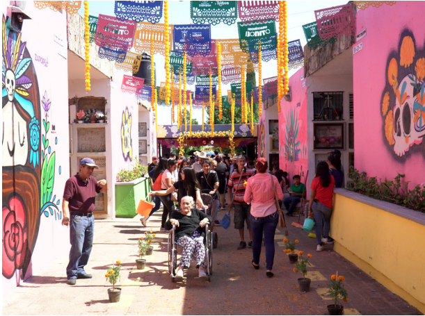
FOTO: Decoración de Día de Muertos