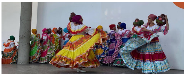
FOTO: Presentación artística del grupo de danza de adultos mayores

Los talleres artísticos no solo ofrecieron una oportunidad invaluable para que los participantes exploren y desarrollen sus habilidades creativas, sino que también desempeñaron un papel crucial en el bienestar físico y mental de la comunidad. Proporcionaron un espacio seguro donde las personas pudieron expresarse libremente, fomentando así la salud y el bienestar general. Además, estos talleres jugaron un papel importante en la promoción y visibilización del talento local, destacando la riqueza cultural y creativa presente en el municipio.