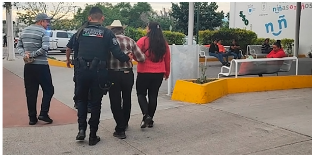
FOTO: Apoyo a adulto mayor

El programa ha impedido situaciones de extravío al entregar este año 74 dispositivos a personas mayores de 60 años: 41 hombres y 33 mujeres. Según el informe de extravíos de la Comisaría General de Seguridad Pública se logró localizar con éxito a un hombre de 87 años que se encontraba extraviado en calles de la colonia Ladrón de Guevara en Guadalajara, gracias a que es un usuario del programa Vuelve a Casa. Este es el segundo caso positivo del programa, por lo que se garantiza la efectividad del programa, equipos y coordinación.