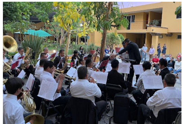
FOTO: Presentación artística

Además, las personas mayores mostraron un interés particular por los conciertos del Centro Cultural Constitución y la Glorieta Chapalita, lugares donde pudieron disfrutar de música en un ambiente acogedor y estimulante. Esta temporada no solo destacó por su impacto cultural y musical, sino también por fortalecer los lazos comunitarios y fomentar el bienestar emocional y mental de las personas mayores a través de las artes.