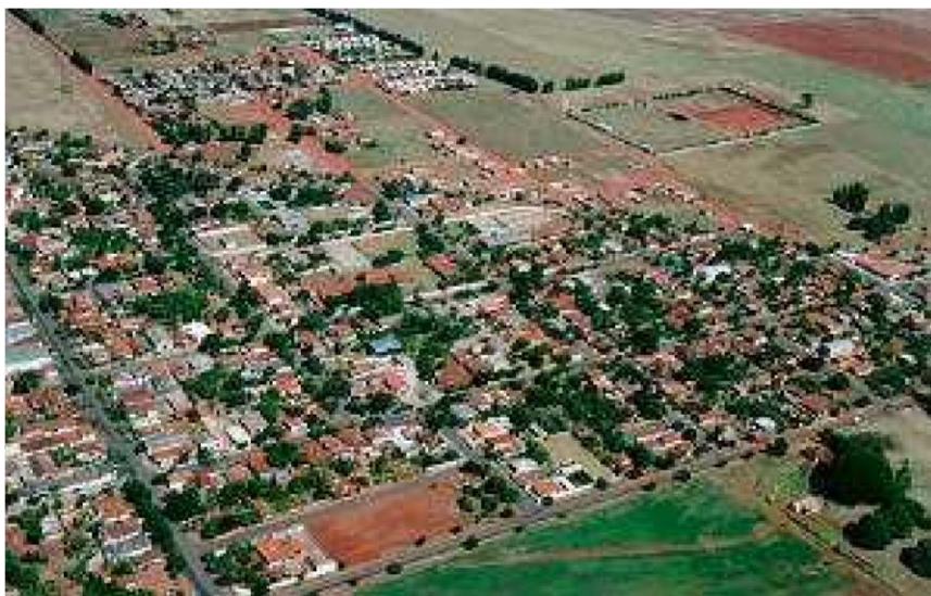
Figura 1 - Imagem do Município

Iguaçu, em Tupi Guanari significa “Canoa Grande”, município de pequeno porte I, localizado ao noroeste do Estado Paraná. Supri sua sociedade em suas demandas: sociais, educacionais, de saúde, esporte e cultura e segurança em mais de 90% com atendimentos públicos de Gestão Básica. Sua colonização ocorreu nos períodos de 1938 a 1940 tendo como referência, ano de 1942, que passou a ser distrito de Astorga. Em 1955 no dia 22 de novembro, ocorre a emancipação política, há 62 anos. Atualmente o município tem como estimativa do IBGE (2010) cerca 4.343 habitantes, IDHM de 0,758, Índice de Pobreza de 42,47 conforme parâmetros do Estado do Paraná.