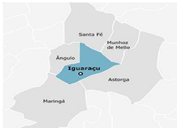
Figura 2 - Aspectos Geográficos do Município

De forma a visualizar sua localização, segue abaixo a figura que apresenta os aspectos geográficos do Município: