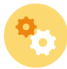
PARTICIPACIÓN CIUDADANA Y EMPLEO