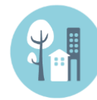
ESPACIOS AL AIRE LIBRE Y EDIFICIOS