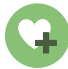
SERVICIOS SOCIALES Y DE SALUD