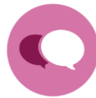
LA PARTICIPACIÓN Y EL TEJIDO SOCIAL