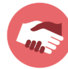
EL RESPETO Y LA INCLUSIÓN