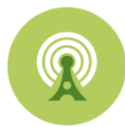
COMUNICACIÓN E INFORMACIÓN