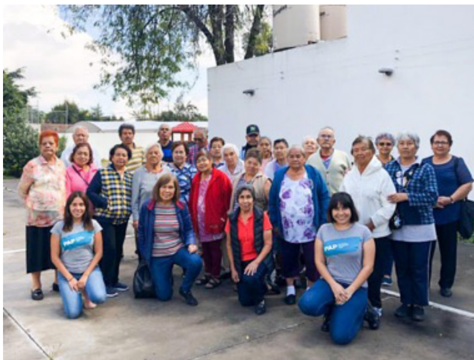
Fuente: Trabajo de campo en centros comunitarios.

Estudiantes PAP de distintas carreras han colaborado con el DIF Guadalajara en propuestas que abonan al eje de salud y bienestar, mismo que corresponde al Plan estratégico para una ciudad amigable con los mayores. Se realizaron talleres que fueron impartidos a personas mayores en centros comunitarios, cuyo fin es el abonar a su bienestar y a la calidad de vida a través de las distintas disciplinas como: nutrición, psicología, arquitectura, comunicación, diseño, comercio y negocios globales son algunas de las carreras que han buscado impactar en la vida cotidiana de hombres y mujeres mayores.