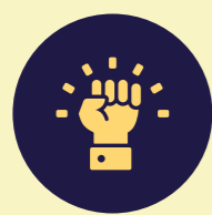
Más Adulto Mayor Autovalente