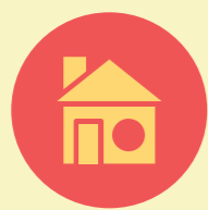
Establecimientos de Larga Estadía para Adultos Mayores