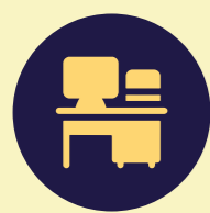
Oficina de Adulto Mayor