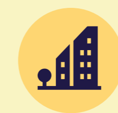
Espacios al aire libre y edificios