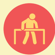
Centro Comunitario de Rehabilitación