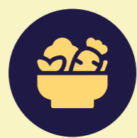
Programa de Alimentación Complementaria del Adulto Mayor