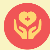
Programa Local de la Red de Cuidados