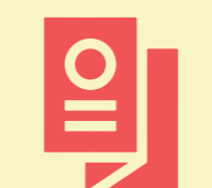
Flyers y dípticos